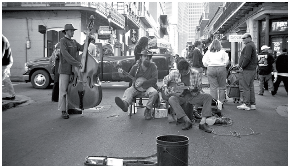
Bunkers fra Bourbon Street, stedet hvor der var liv og glade dage og hvor jazzen var et must.

Turen gik nu fra New Orleans til Port Arthur i Texas for bunkers af olie og så videre over Atlanten til Monrovia i Liberia, hvor der skulle 30 (svartinge) om bord, som nordmændene kaldte dem, det var det vi andre kaldte for Crew Boyes eller negere, som skulle tage sig af alt det arbejde om bord, som ingen andre gad lave. De arbejdede fra kl. 5.00 morgen til langt ud på aftenen for sølle