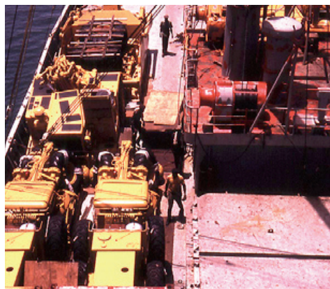
Her ses en del af dækslasten som var dozere til Abidjan hovedstaden i Elfenbenskysten.

Den ene dag, da jeg kom på dæk, var der et stort postyr på kajen. Det viste sig, at bådmanden havde overrasket en tyveknægt i malershoppen, som var i færd med at stjæle maling. Her var nu kontant afregning fra bådmandens side, der havde en kort lunte, og såvel maling som tyveknægt røg over skibssiden. Der var 10 meter ned til kajen - og under meget postyr af hans medsamsvorne, som opholdt sig på kajen for at afhente tyvekosterne. Tyven overlevede i første omgang, indtil to af før omtalte betjente bankede ham med spark og knipler, så han næppe kunne have overlevet dette grove overfald. Det viste helt klart, hvad respekt de havde for et menneskeliv. En anden gang var vi gået