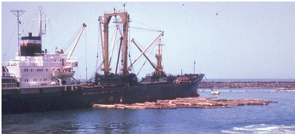
Nopal Vega ved at laste tømmer.