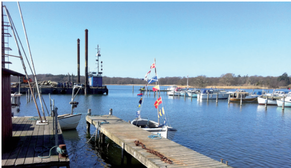
Smakkebåden "Rigmor 2" tilbage i sit rette element. Mast, rigning og sejl er blevet monteret sidst i maj måned.